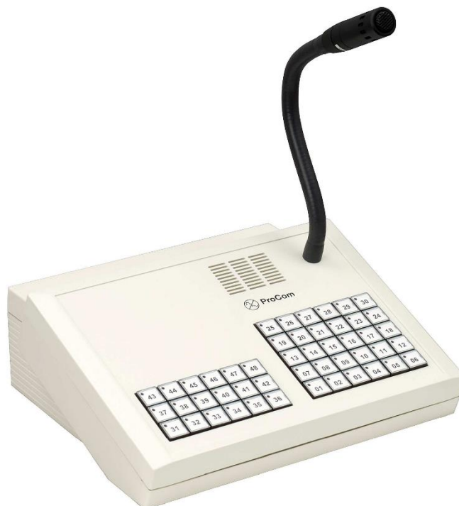
Abb. DTA-048 (L- Nr. 1.048)